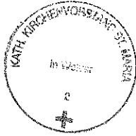
Siegel des Kirchenvorstandes